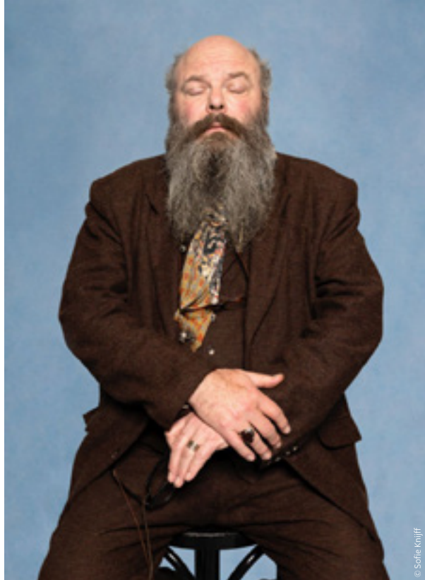
🕒 Schopenhauer (14/2)