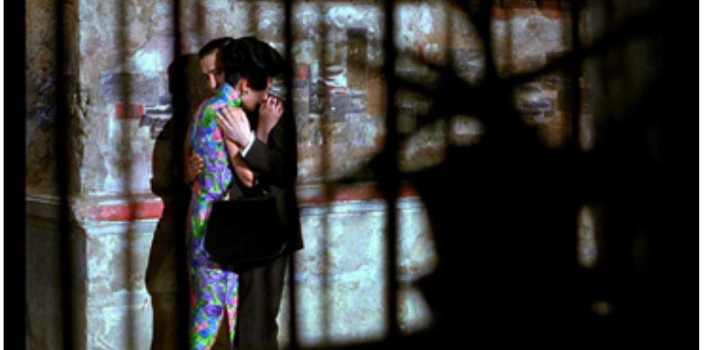
📍 In the mood for love (11/2)